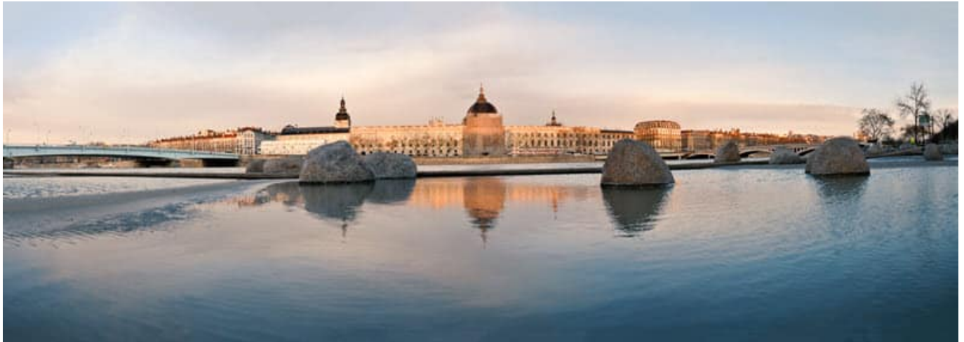
Quais du Rhône

n'est apparu qu'au début des années soixante-dix ... Si vous n'êtes pas Capa, vous bénéficiez en revanche d'un matériel bien plus évolué que lui aujourd'hui !