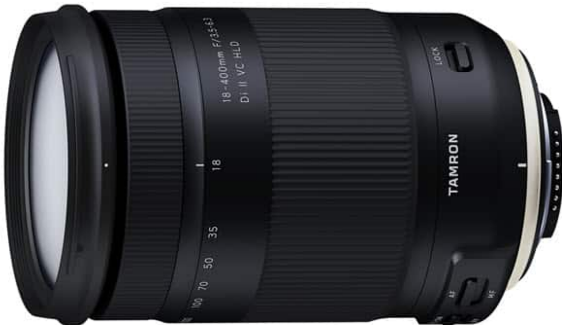
Tamron 18-400mm f/3,5-6,3 Di II VC HLD en version Nikon DX