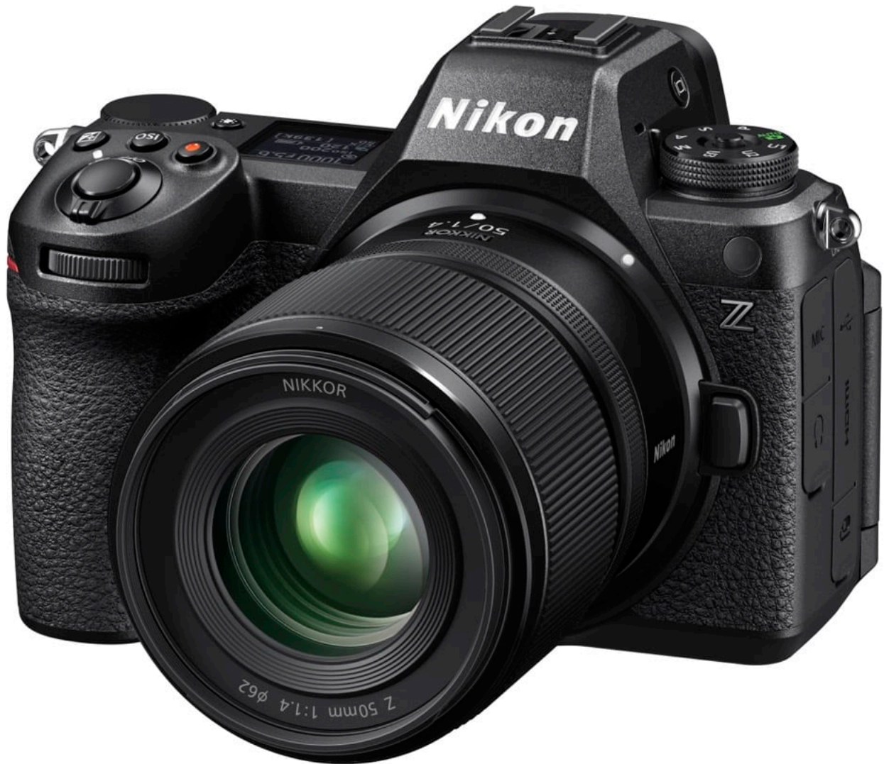
le NIKKOR Z 50 mm f/1.4 monté sur le Nikon Z 6III